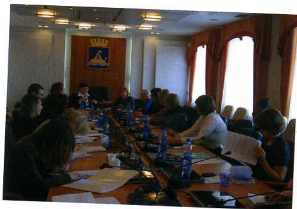
ММЛПУ «Городская поликлиника №8» (поселок ММС)

ММЛПУ «Городская поликлиника №8», в холле филиала ММЛПУ «Городская поликлиника №8» (поселок ММС), на первом этаже рынка «Ватутинский».